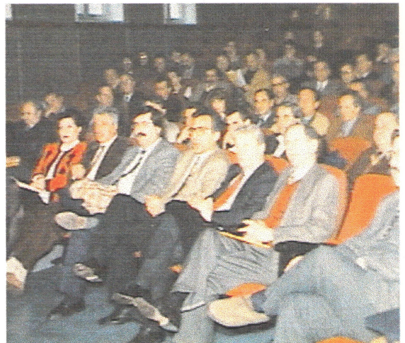
Στο αμφιθέατρο του ΤΕΕ Μαγνησίας, Βουλευτές, εκπρόσωποι αρμοδίων φορέων καθώς και πολίτες της περιοχής.