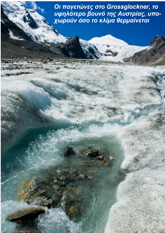
Οι παγετώνες στο Grossglockner, το υψηλότερο βουνό της Αυστρίας, υποχωρούν όσο το κλίμα θερμαίνεται