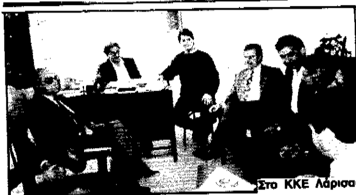
Στο ΚΚΕ Λάρισα

Ταυτόχρονα θα γίνει προσπάθεια να ενεργοποιηθούν οι 12 ευρωβουλευτές της Ν. Δημοκρατίας ώστε να εμποδίσουν τις ενέργειες που ήδη δρομολόγησαν στην ΕΟΚ οι αντιπρόσωποι στο έργο. Δόθηκε επίσης η υπόσχεση για βοήθεια ώστε να επιτευχθεί ο στόχος της σύμβασης.