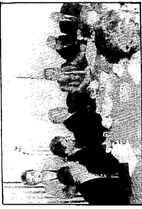
Με τους βιομηχάνους οι οποίοι πρόκειται να κλείσει στην Βόσνια εμφύλιο

Με το Ν.Δ. 1297/72 θεσπίσθηκαν κίνητρα για την συγχώνευση επιχειρήσεων, η δε ισχύς των διατάξεων αυτού έληξε την 31-12-1992, και μέχρι σήμερα