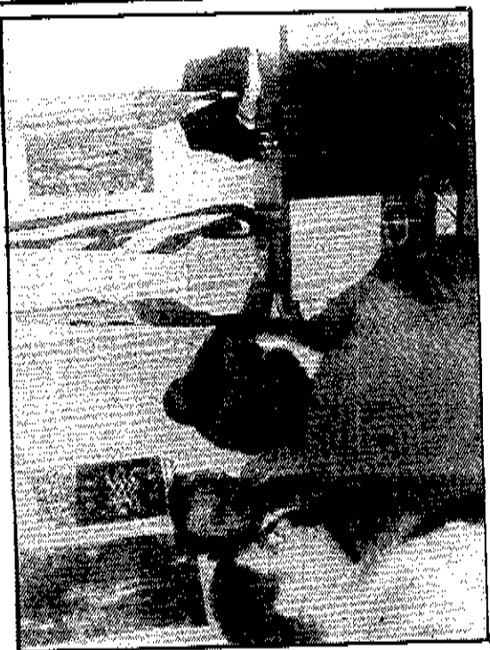
...Αλλά και σε κομματική σύσκεψη στα γραφεία της Νέας Δημοκρατίας

ρα οι ενδιαφερόμενες επιχειρήσεις αδυνατούν να πραγματοποιήσουν τα επενδυτικά τους σχέδια, λόγω ελλείψεως κινήτρων.